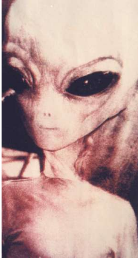
Grigio di Zeta Reticuli

Mettere tali sostanze sotto la lingua non è l'unico modo di nutrirsi dei Grigi. Nelle mutilazioni di bestiame il sangue viene totalmente drenato dai corpi. I Zetas hanno nelle loro basi contenitori con organi di esseri umani e di animali immersi in un liquido ambrato.