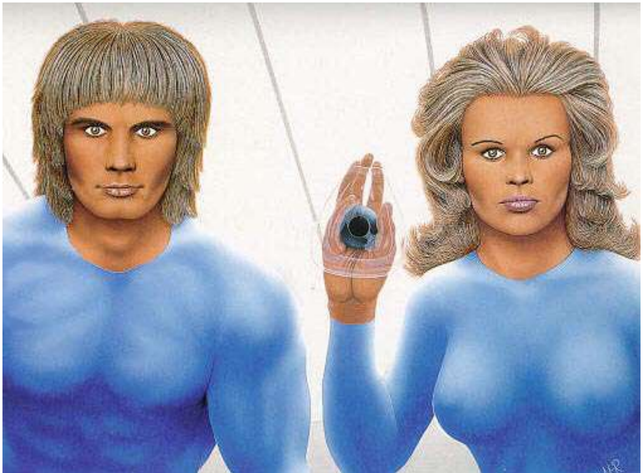
Rappresentazione di alieni Pleiadiani

Hanno capelli biondi e pelle chiara e sono alleati della confederazione spaziale ed intergalattica. Alcuni pleiadiani sono sottomessi ai grigi essendo stati rapiti da bambini o essendo discendenti di rapiti; questi sono stati allevati e addestrati dai grigi come loro schiavi. I Pleiadiani hanno avuto in passato molti contatti con i terrestri ma di recente hanno sospeso le loro visite alla Terra a causa di una legge spaziale che vieta loro di interferire nel destino delle altre razze, a meno che queste non mettano in pericolo le altre specie della galassia. Se ci dovesse essere la minaccia di una guerra nucleare essi interferirebbero allo scopo di scongiurarla. I Pleiadiani hanno più volte messo in guardia i governi terrestri dal pericolo rappresentato dai grigi.